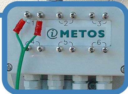
Metos weather data